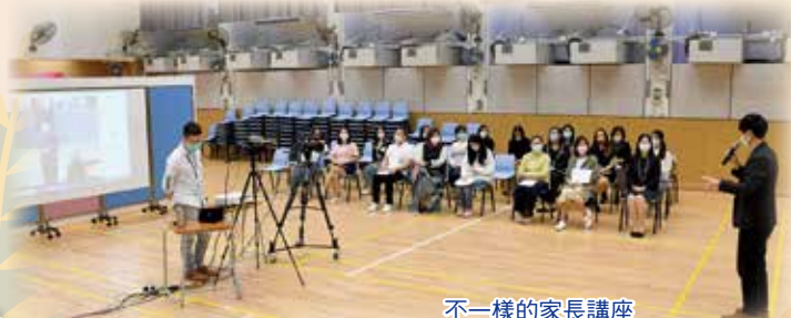
不一樣的家長講座