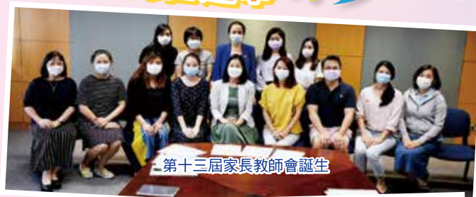
第十三屆家長教師會誕生